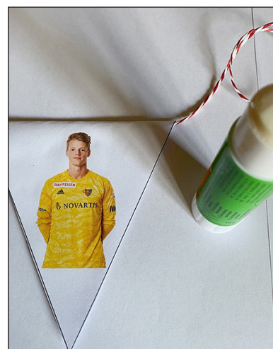
Wimpel mit der eingeklemmten Schnur zusammenkleben