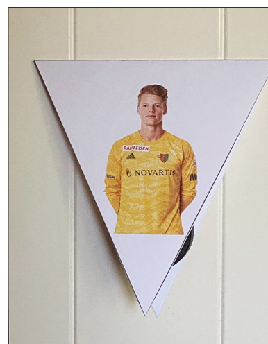
In der Mitte falten